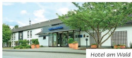
Hotel am Wald