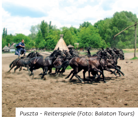
Puszta - Reiterspiele

Heute verlassen Sie Europas größten Binnensee und fahren in Richtung Budapest. Auf halber Strecke liegt Ungarns älteste Stadt Székesfehérvár . Die im 10. Jahrhundert gegründete Stadt lernen Sie bei einem Stadtrundgang kennen. Am späten Nachmittag erreichen Sie die Hauptstadt der Magyaren – Budapest . Bei einer kleinen Stadtrundfahrt zeigt Ihnen Ihre Reiseleitung die wichtigsten Sehenswürdigkeiten . Abendessen und Übernachtung im Actor Hotel Budapest.