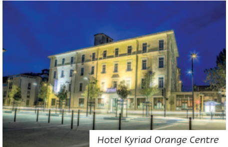
Hotel Kyriad Orange Centre

Das Mittelklassehotel liegt im historischen Zentrum der provenzalischen Stadt Orange, nur ca. 300 m entfernt vom Triumphbogen. Alle 60 Zimmer sind ausgestattet mit Bad oder DU/WC, Sat-TV, Telefon, Klimaanlage und Haarföhn. Dem Hotel angeschlossen ist ein geschmackvoll eingerichtetes Restaurant.