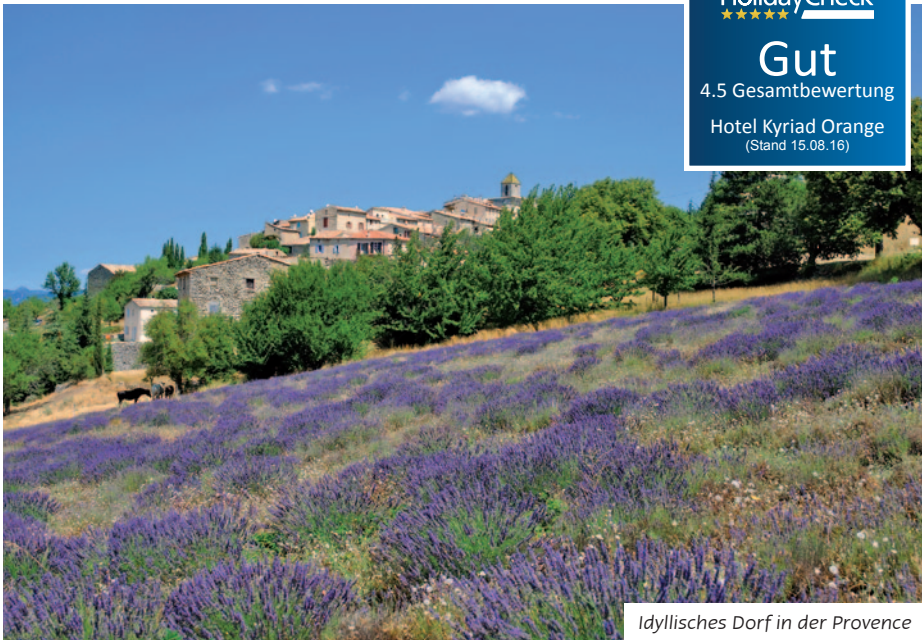
Idyllisches Dorf in der Provence