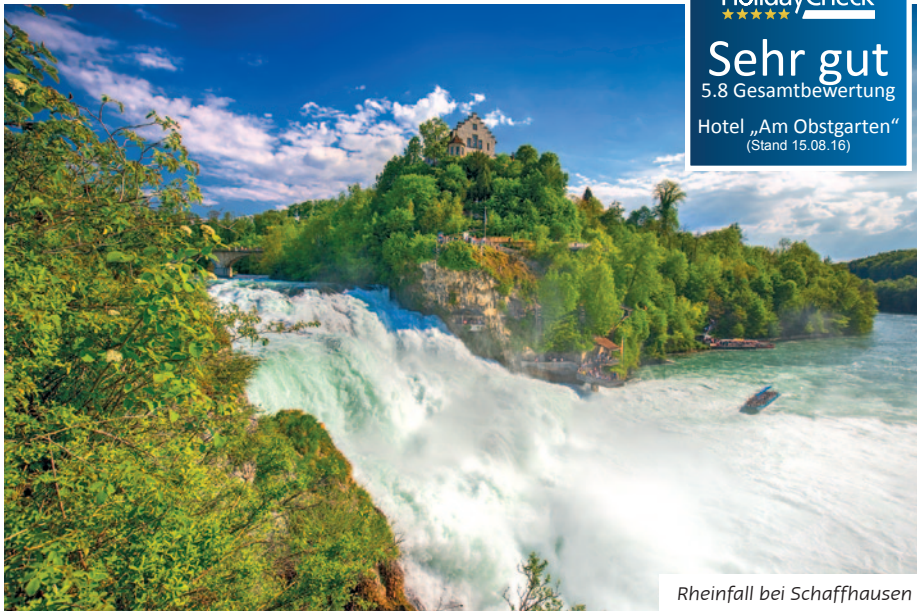
Rheinfall bei Schaffhausen