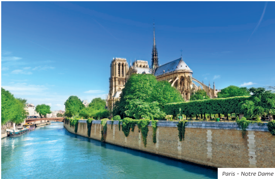
Paris - Notre Dame