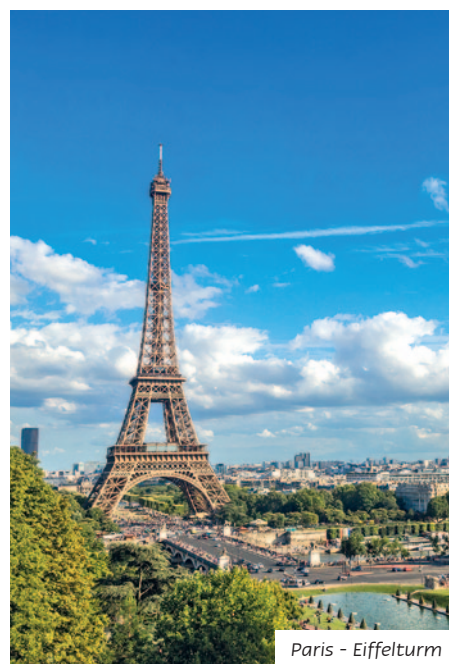
Paris - Eiffelturm