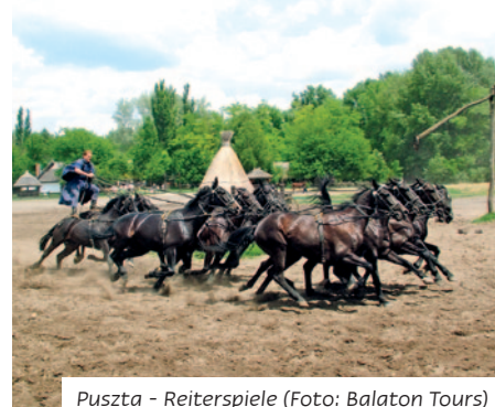
Puszta - Reiterspiele

Frühstücksbuffet. Heute steht ein Ausflug ins Donauknie auf dem Programm. Sie fahren entlang der Donau in die Künstlerstadt Szentendre . Die vielen Souvenirs und Antiquitätenläden werden Sie faszinieren. Weiter geht es nach Esztergom , eine der ältesten Städte Ungarns.