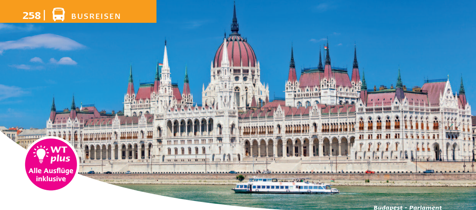
Budapest - Parlament