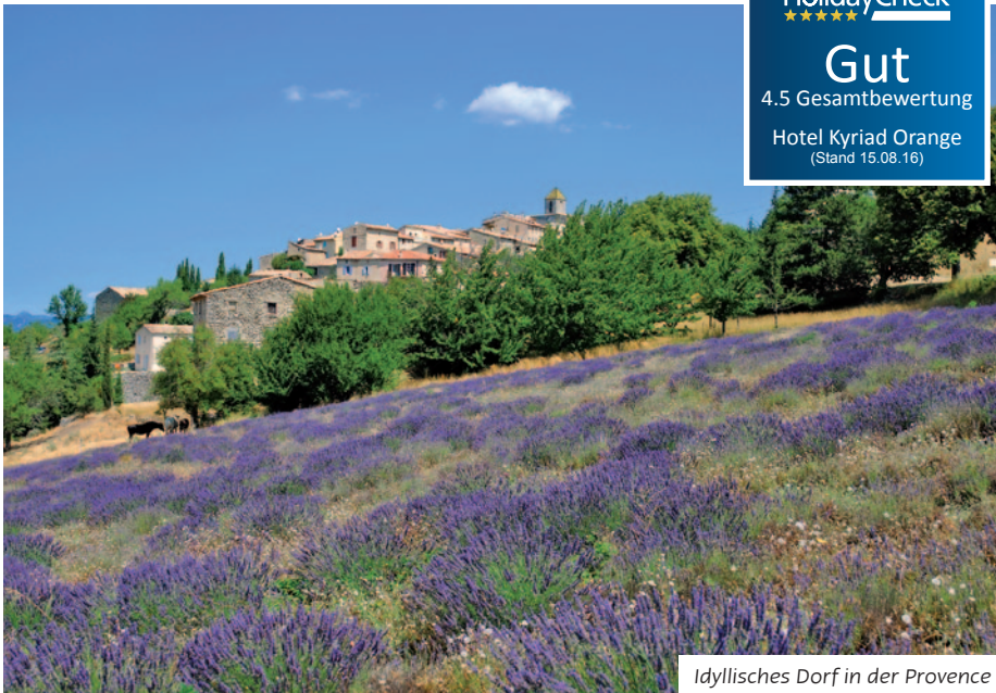
Idyllisches Dorf in der Provence