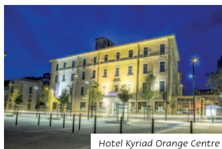
Hotel Kyriad Orange Centre

Das Mittelklassehotel liegt im historischen Zentrum der provenzalischen Stadt Orange, nur ca. 300 m entfernt vom Triumphbogen. Alle 60 Zimmer sind ausgestattet mit Bad oder DU/WC, Sat-TV, Telefon, Klimaanlage und Haarföhn. Dem Hotel angeschlossen ist ein geschmackvoll eingerichtetes Restaurant.