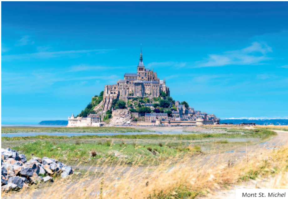
Mont St. Michel