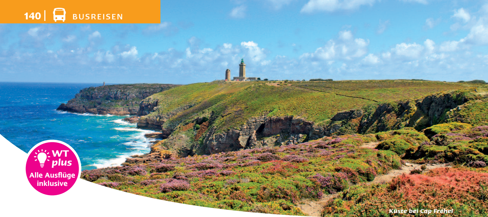
Küste bei Cap Fréhel