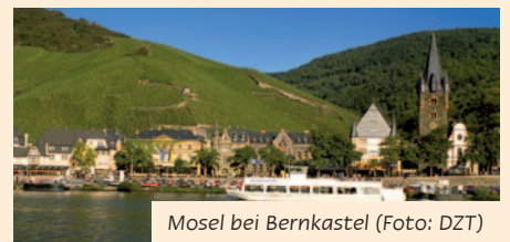
Mosel bei Bernkastel

Eventuelle Eintritts- und Besichtigungsgelder sind im Reisepreis nicht enthalten. Gültiger Personalausweis erforderlich. Die Abfahrtszeit für den gebuchten Zustiegsort steht auf den Reiseunterlagen. Ankunfts- und Abfahrtszeiten vorbehaltlich Änderung! Mindestteilnehmerzahl: 20 Personen bei einer Absagefrist bis spätestens 6 Wochen vor Reisebeginn.