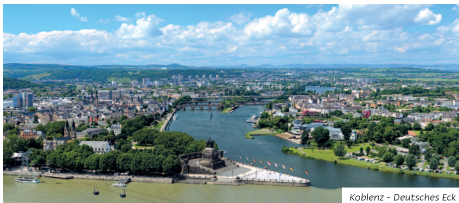
Koblenz - Deutsches Eck