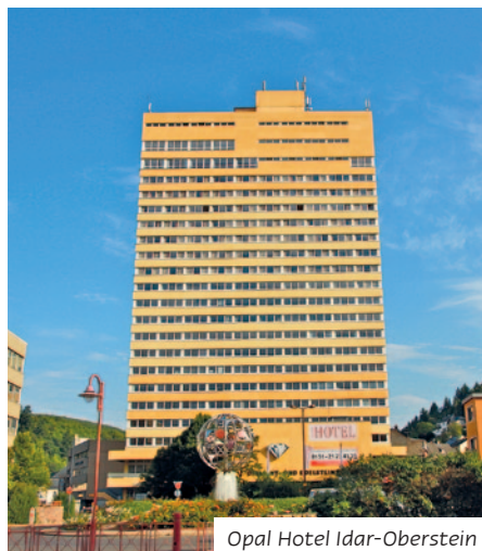
Opal Hotel Idar-Oberstein

Das Opal Hotel Idar-Oberstein liegt direkt an der Deutschen Edelsteinstraße in Idar-Oberstein und bietet einen traumhaften Blick über die Stadt. Die insgesamt 80 komfortabel ausgestatteten Zimmer verfügen über Bad/WC, Haarföhn, Sat-TV, Telefon und Schreibtisch. Das abwechslungsreiche Frühstücksbuffet nehmen Sie in der 19. Etage des Hotels über den Dächern der Stadt ein sowie das Abendessen im Idarer Brauhaus (ca. 150 m vom Hotel entfernt). Des Weiteren stehen den Gästen Lobby, Lift und eine Bar zur Verfügung.