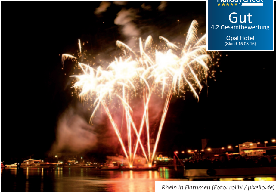
Rhein in Flammen