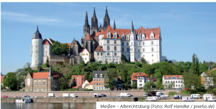
Meißen - Albrechtsburg

Nachdem Sie ausgiebig gefrühstückt haben, machen Sie einen Abstecher in die Sächsische Schweiz. Das von der Elbe und ihren Nebenflüssen geformte Areal mit seinen bizarren Riffen, tiefen Schluchten, Felswänden und Tafelbergen wechselt ständig den Charakter der Natur. Die schönsten Eindrücke gewinnen Sie von der 305 m hoch gelegenen Bastei aus, wo der Blick weit ins Land schweift. Danach fahren Sie nach