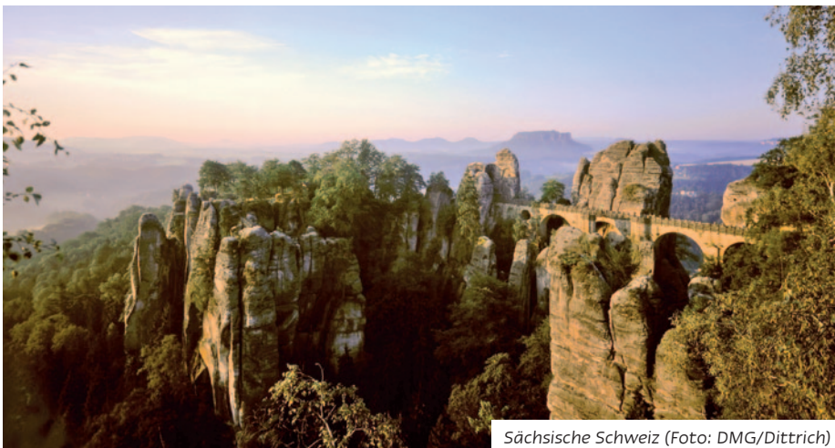
Sächsische Schweiz

Das familiengeführte Hotel Evabrunnen liegt im Zentrum von Bischofswerda. Die 41 liebevoll eingerichteten Zimmer verfügen über DU/WC, Haarföhn, Sat-TV mit Radioprogrammen, Schreibtisch, Minibar, Telefon und WLAN. Den Gästen des Hotels stehen Rezeption, Lobby, Pub und Lift zur Verfügung. Im Restaurant genießen Sie Speisen aus lokalen Produkten.