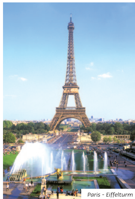
Paris - Eiffelturm