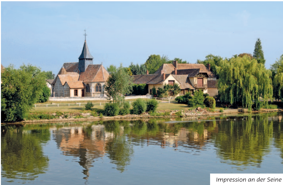
Impression an der Seine