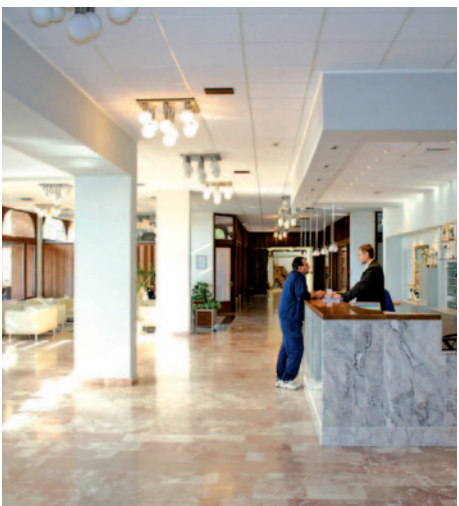
Hotel Biokovka - Rezeption

Durchführungsgarantie ab 20 Personen D = Doppel, E = Einzel, T = Doppel/Zustellbett