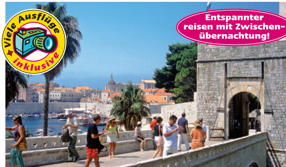
Dubrovnik - Stadtmauer

schon Stadtkern, der von einer venezianischen Mauer umgeben ist. Zadar wird als Perle der kroatischen Kultur und Geschichte gepriesen (Extrakosten 20,- EUR p.P.).