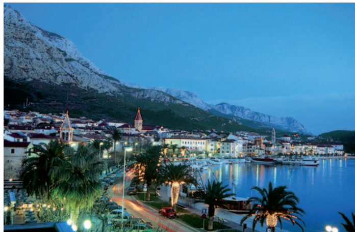
Makarska am Abend