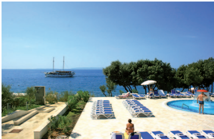
Hotel Luna - Pool