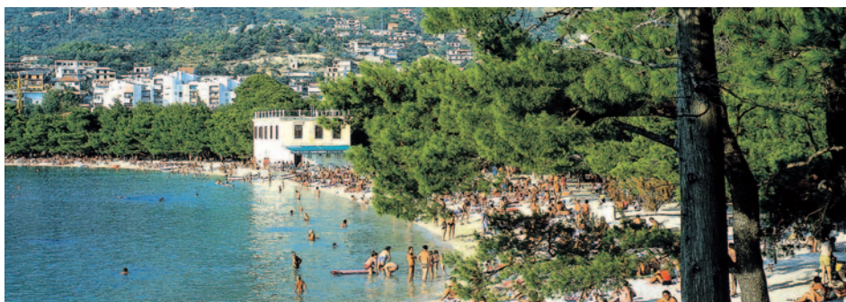
Riviera von Makarska

Entspannter reisen mit Zwischenübernachtung!