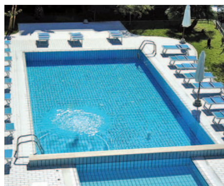
Hotel Garden - Pool

Dauerhaft günstig: Ihr Reisepreis p.P. ab € 698,-