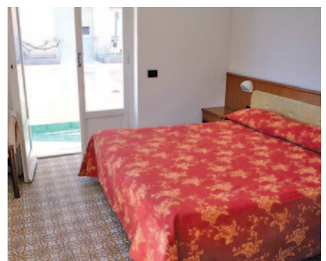
Hotel Garden - Zimmerbeispiel

Durchführungsgarantie ab 20 Personen D = Doppel, E = Einzel, T = Doppel/Zustellbett