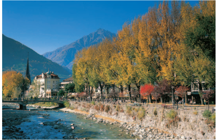
Meran - Kurpromenade an der Passer