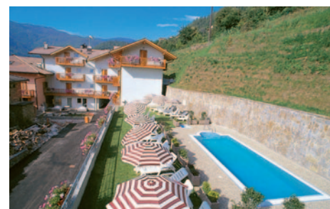
Hotel Alle Piramidi

Hotel Alle Piramidi*** (Landeskategorie) Unser langjähriges Vertragshotel „Alle Piramidi“ in Segonzano ist ein familiengeführtes, gutes Mittelklassehotel im Herzen vom Trentino. Alle 36 Gästezimmer sind gemütlich eingerichtet und ausgestattet mit Bad oder DU/WC, Telefon und TV. Das Nichtraucher-Hotel verfügt über ein Außen-Schwimmbad, Restaurant, Bar und Fahrstuhl. Außerdem haben Sie im Hotel die Möglichkeit, das kleine Wellness-Zentrum mit Massage, Hand- und Fußpflege, Sauna und Solarium zu nutzen (gegen Gebühr; Sonntags geschlossen).