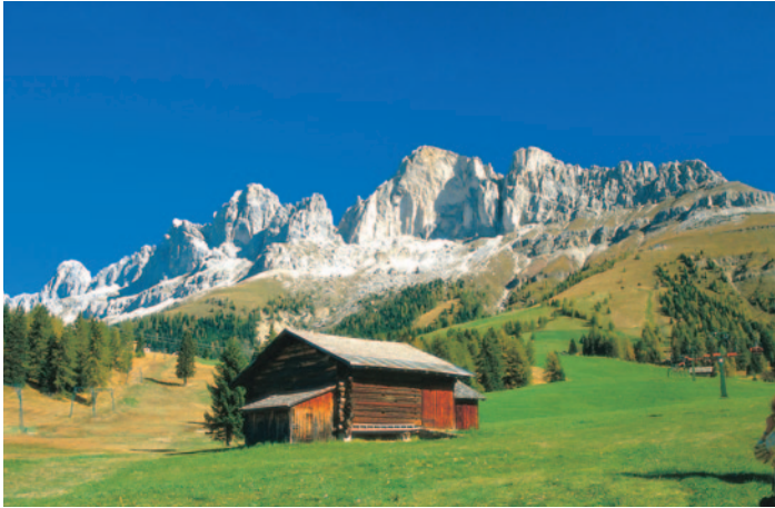
Herrliche Bergwelt Südtirols