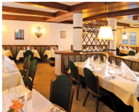
Hotel Dachstein - Restaurant

Das familiengeführte 4-Sterne-Hotel liegt im beschaulichen Ort Filzmoos, unter den sagenumwobenen Alpengipfeln des Dachsteins im Salzburger Land. Es bietet seinen Gästen Restaurant, Bar und einen Wellnessbereich mit finnischer Sauna, Dampfbad, Sanarium, Ruheraum, Solarium und Massagen (Solarium und Massagen gegen Gebühr). Alle 34 Zimmer sind mit Bad oder DU/WC, Haarföhn, Radio, Safe, Telefon, Sat-TV und teilweise Balkon ausgestattet. Einzelzimmer sind Doppelzimmer zur Alleinbenutzung.