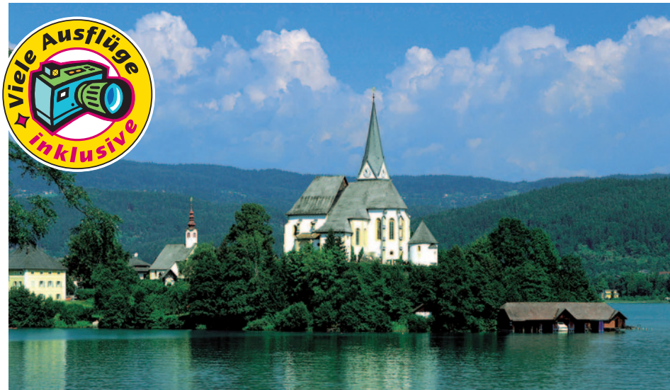
Kirche Maria Wörth

schernden Gebirgsbächen, führt die Fahrt zu Ihrem ersten Zwischenhalt in St. Gilgen. Von hier aus haben Sie die Möglichkeit zu einer Schifffahrt (Extrakosten ca. 7,- EUR p.P.) von St. Gilgen nach St. Wolfgang. Weiter geht es über das charmante Bad Ischl vorbei an Gosau zum Hallstätter See nach Hallstatt. Der Ort wird von vielen als der „schönste Seeort der Welt“ bezeichnet, und ist seit 1997 von der UNESCO als Weltkultur- und Naturerbe ausgezeichnet. Abendessen und Übernachtung im Hotel Dachstein in Filzmoos.