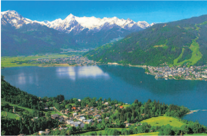
Blick auf den Zeller See