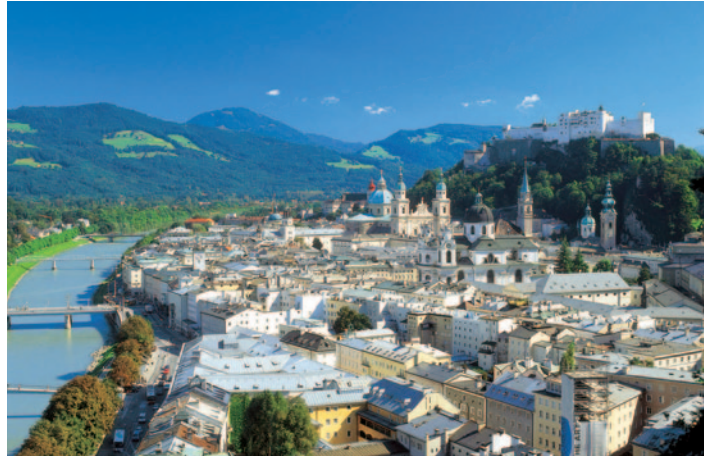
Blick auf Salzburg