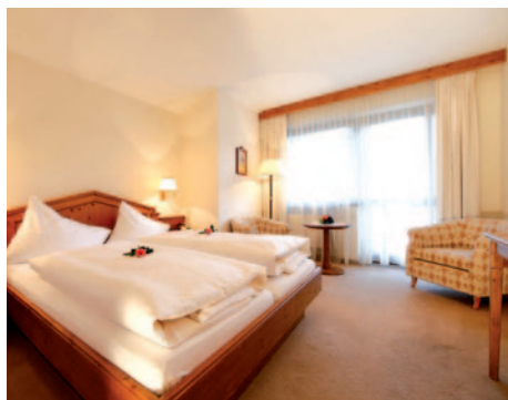
Hotel Dachstein - Zimmerbeispiel