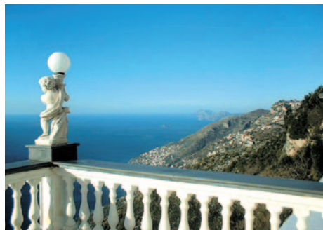
Ausblick vom Hotel

Frühstücksbuffet. Transfer zum Flughafen Neapel und Rückflug mit Air Berlin nach Berlin/Tegel.