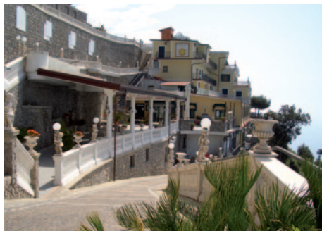
Gran Hotel Sant' Orsola