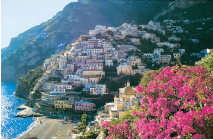
Blick auf Positano