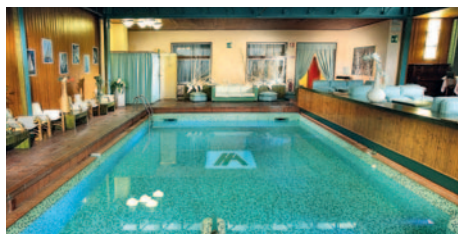
Hotel Ambrosiano - Schwimmbad

Das familiengeführte 3-Sterne-Hotel Ambrosiano liegt zentral am Anfang der Fußgängerzone im lebhaften Kurort Montecatini Terme (Fahrverbot für Pkw von 20:00 Uhr bis 06:00 Uhr). In einem historischen Gebäude untergebracht bietet es seinen Gästen ein Restaurant welches direkt an das schöne Hallenbad anschließt. Dieses kann am Abend geschlossen und zu einer großen Tanzfläche umfunktioniert werden. Des Weiteren verfügt das Haus über eine Bar, gesellige Aufenthaltsbereiche, einen Lift und eine kleine Terrasse. Alle 69 Zimmer sind in Größe und Einrichtung unterschiedlich und ausgestattet mit Bad oder DU/WC, Haarföhn, Telefon, Sat-TV, Safe, Klimaanlage und teilweise Balkon. Hinweis: Aufgrund der engen Straßen in Montecatini Terme kann der Bus nur ca. 150 m vom Hotel entfernt halten (kein Kofferservice).