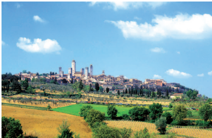
San Gimignano