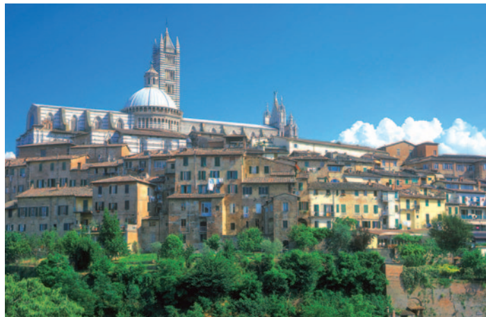
Siena – Altstadt mit Dom