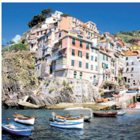
Cinque Terre

Frühstücksbuffet. Heute geben wir Ihnen die Gelegenheit, an einem Ausflug nach Lucca und Viareggio teilzunehmen (Extrakosten 20,- EUR p.P.). Lucca wird mit seinen 93 Kirchen und Kapellen auch „der kleine Vatikan in der Toskana“ genannt. Die Stadt ist bekannt für ihren 12 m hohen und von Gräben umgebenen