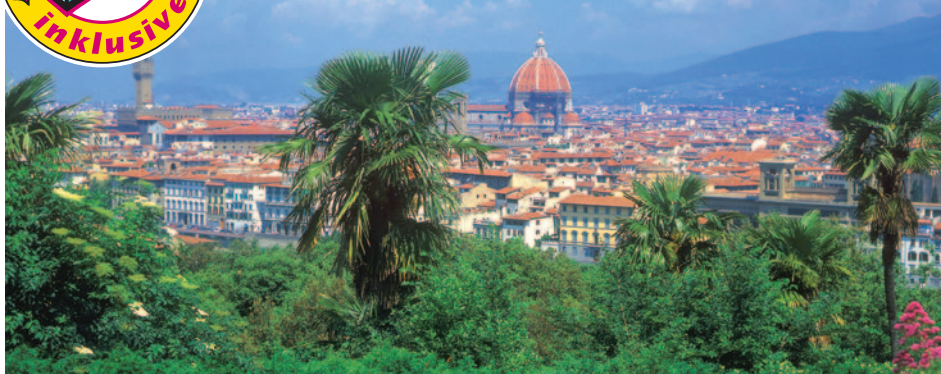
Blick auf Florenz

Entspannt reisen mit Zwischen- übernachtung!