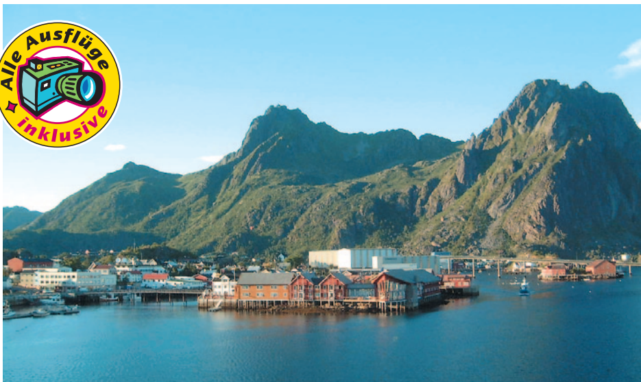
Svolvær - Lofoten