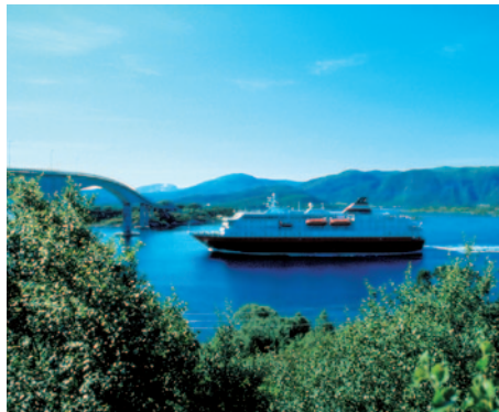
Postschiff im Fjord

Frühstücksbuffet und Stadtrundfahrt/Stadtspaziergang durch Oslo. Sie sehen das königliche Schloss, die Festung Akershus u.v.m. Gegen Nachmittag erfolgt der Transfer zum Flughafen Oslo-Gardemoen und anschließender Rückflug mit Air Berlin nach Berlin/Tegel. Nach der Ankunft Transfer zum gebuchten Zustiegsort und Taxiservice bis zu Ihrer Haustür.