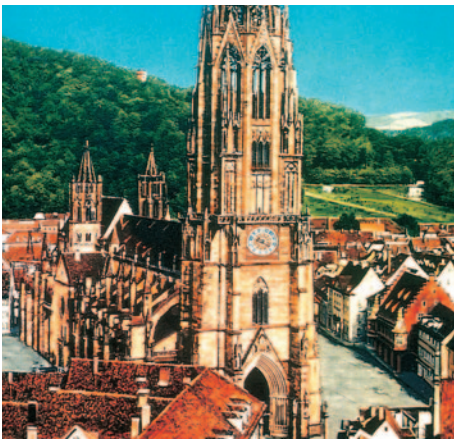
Freiburg - Münster

Nachdem Sie ausgiebig gefrühstückt haben, machen Sie einen Abstecher nach Frankreich, in die nahe gelegenen Vogesen. Sie fahren zuerst nach Colmar. Bei einer Stadtrundfahrt / -rundgang können Sie die schöne Altstadt mit ihren historischen Bauten kennenlernen. Weiter geht es vorbei an den Hängen der Vogesen, in das schöne Weindorf Riquewihir, wo Sie persönlich auf Erkundungsreise gehen können. Abendessen und Übernachtung im Hotel Löwen in St. Märgen.