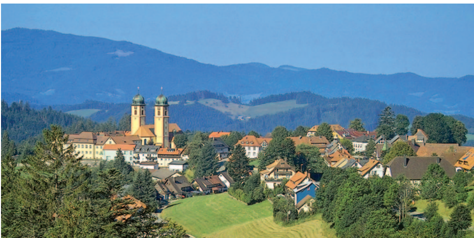
Blick auf St. Märgen

Dauerhaft günstig: Ihr Reisepreis p.P. ab € 458,-