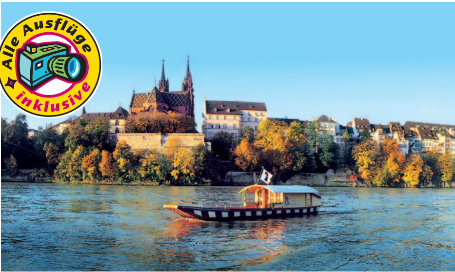
Basel - Rheinpanorama

unternehmen (Extrakosten ca. 4,- EUR p.P.). Abendessen und Übernachtung im Hotel Löwen in St. Märgen.