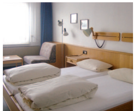
Hotel Löwen - Zimmerbeispiel

Durchführungsgarantie ab 20 Personen D = Doppel, E = Einzel, T = Doppel/Zustellbett