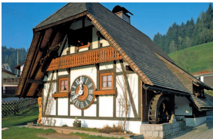
Triberg - Kuckucksuhr