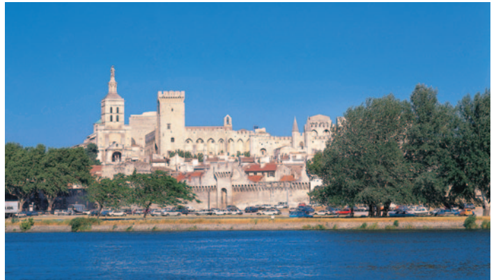
Papstpalast in Avignon