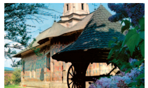
Bukowina – Kloster Moldovita

Nach dem Frühstücksbuffet fahren Sie nach Biertan (Birthälml) und besichtigen die größte aller Wehrkirchen. Danach erreichen Sie die mittelalterliche Burg Sighisoara (Schässburg), die auch heute noch bewohnt ist. Die alten Gassen der Stadt führen Sie zurück in eine