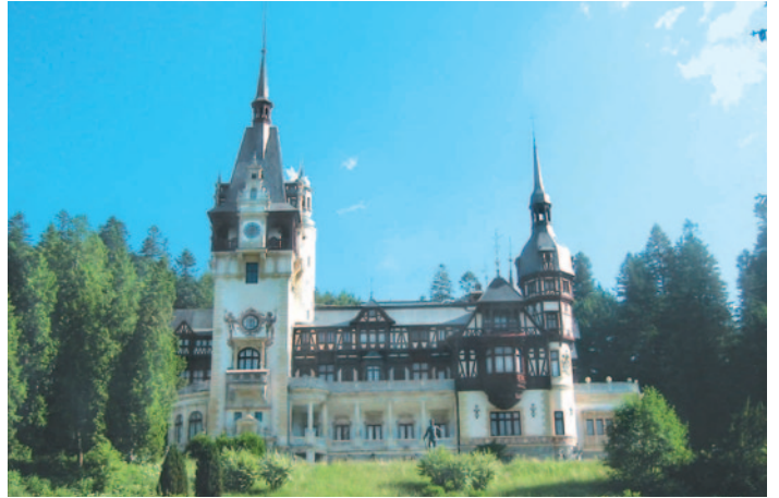
Sinaia – Schloss Peles