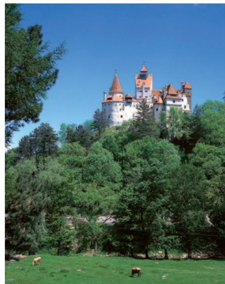
Bran - „Burg Dracula“

Durchführungsgarantie ab 20 Personen D = Doppel, E = Einzel