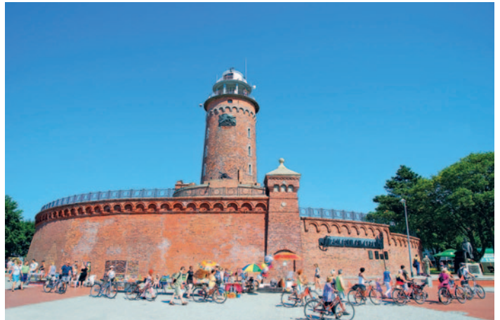
Kolberg - Leuchtturm