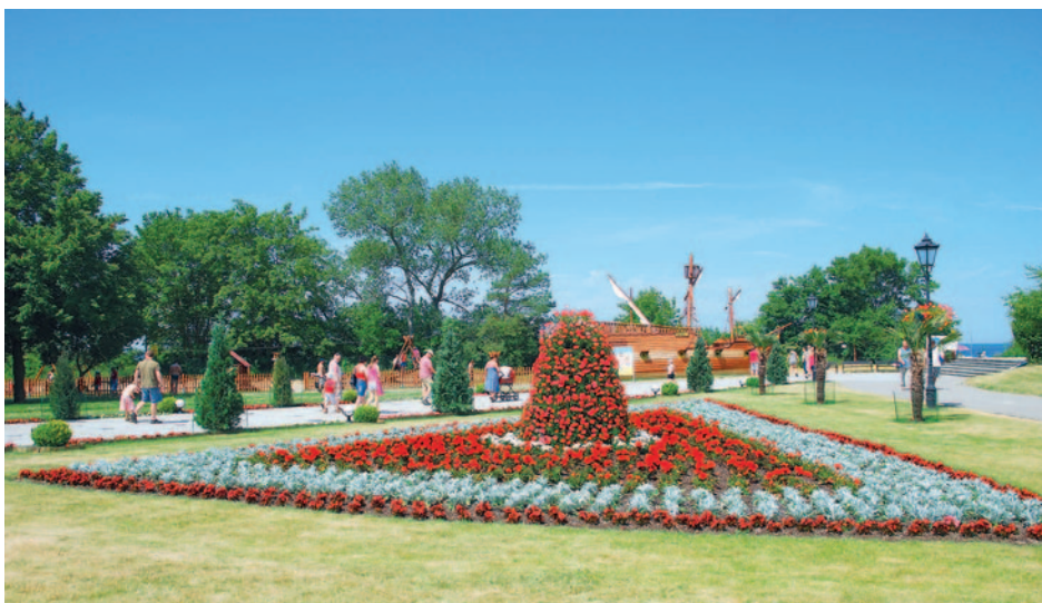
Misdroy - Kurpromenade

Dauerhaft günstig: Ihr Reisepreis p.P. ab € 288,-