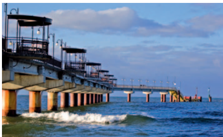
Seebrücke in Misdroy