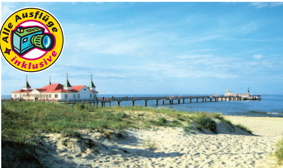
Seebrücke auf Usedom

ein einzigartiges Reservat der Pflanzen- und Tierwelt. Die Kombination von Mischwäldern, unberührten Seen und der Küste verleihen diesem Naturparadies seinen reizvollen Charakter. Die letzten europäischen Wisente können hier beobachtet werden. Anschließend Fahrt zum zentralen Abfahrtsort Magdeburg. Nach der Ankunft um ca. 16:30 Uhr Transfer zum gebuchten Zustiegsort und Taxiservice bis zu Ihrer Haustür.