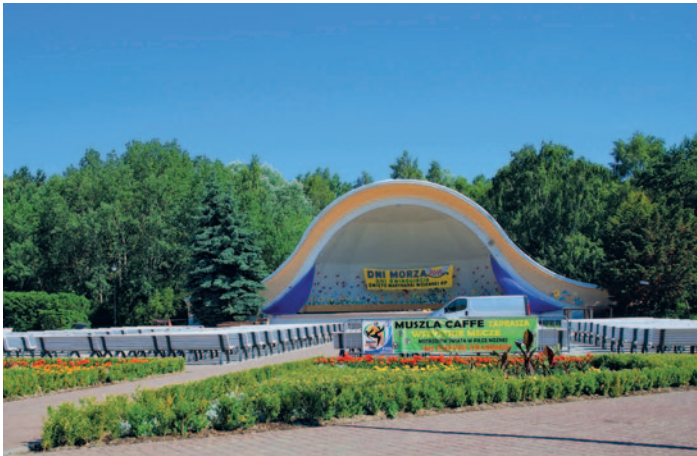
Swinemünde - Konzertmuschel