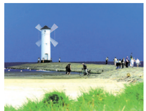
Leuchtturm von Swinemünde

Frühstücksbuffet und Rückreise. Auf der Fahrt erkunden Sie noch den Wolinski-Nationalpark,