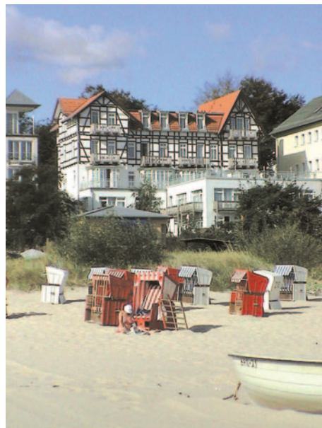
Bäderarchitektur auf Usedom

sich alle im neuen Gebäudeteil des Hotels. Die 86 Zimmer sind alle mit DU/WC, Radio, Sat-TV, Telefon und Balkon (z.T. französische Balkons) ausgestattet. Den Gästen des Hotels stehen ein Lift, ein klimatisiertes Restaurant sowie ein Café zur Verfügung. Wer Entspannung sucht, findet diese bestimmt in der Sauna (Extrakosten), der Salzgrotte, im Whirlpool, im Fitnessraum oder im Hallenschwimmbad.