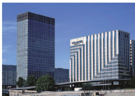
Hotel Novotel La Défense

Sie haben die Möglichkeit, für diese Reise einen HP-Zuschlag zuzubuchen: 5 x 3-Gang-Abendessen in den Hotels in Paris und Brüssel (ohne Getränke), Preis: 130,- EUR pro Person.