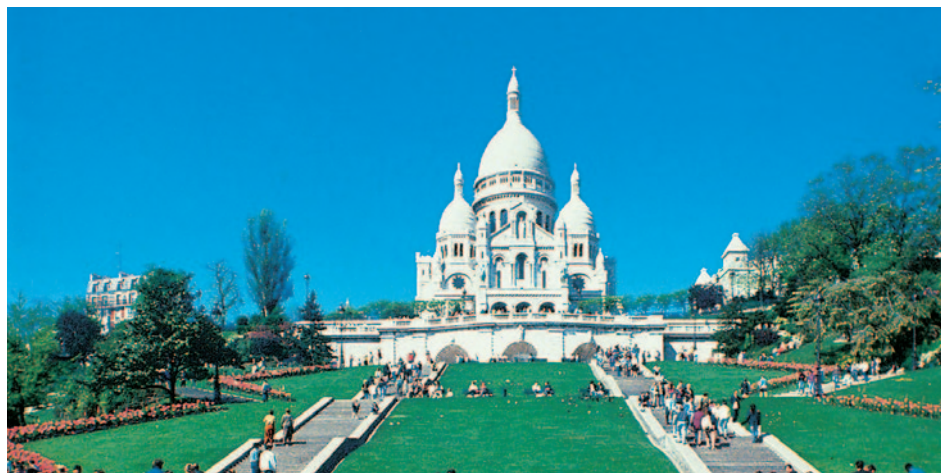
Sacre Coeur

Eventuelle Eintritts- und Besichtigungsgelder sind im Reisepreis nicht enthalten. Gültiger Personalausweis erforderlich. Die Abfahrtszeit für den gebuchten Zustiegsort steht auf den Reiseunterlagen. Ankunfts- und Abfahrtszeiten vorbehaltlich Änderung!