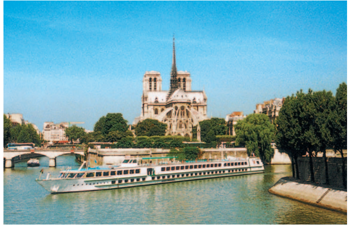
Blick auf Notre Dame