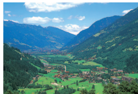
Blick ins Gasteiner Tal

Nach dem Frühstücksbuffet unternehmen Sie eine Ausflugsfahrt in die herrliche Gasteiner Bergwelt und nach Bad Gastein. Bei einem Aufenthalt genießen Sie das besondere Flair des weltberühmten Kurortes. Dann fahren Sie weiter durch das Kleinartal, welches von Bergen über 2600 m eingerahmt nahe des Nationalparks Hohe Tauern liegt. Der Jägersee lädt zu einem herrlichen Spaziergang ein. Anschließend geht die Fahrt über St. Johann