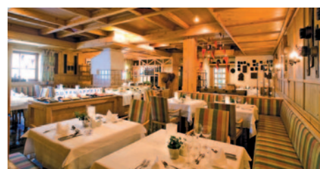
Hotel Glemmtalerhof - Restaurant

Durchführungsgarantie ab 20 Personen D = Doppel, E = Einzel, T = Doppel/Zustellbett