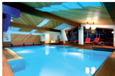
Hotel Glemmtalerhof - Schwimmbad