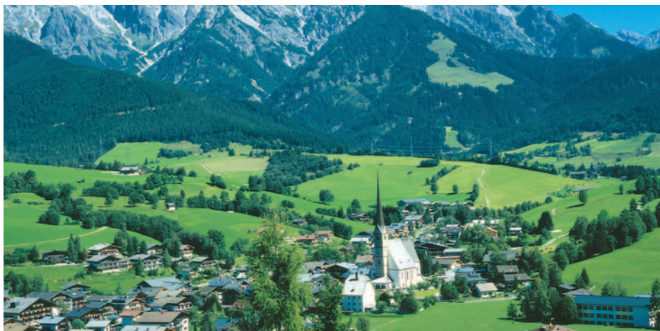
Blick auf Maria Alm

Dauerhaft günstig: Ihr Reisepreis p.P. ab € 468,-