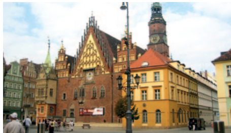
Breslau - Rathaus

mer, die alle mit DU/WC, Sat-TV und Telefon ausgestattet sind. Nichtraucher- und behindertenfreundliche Zimmer stehen auf Anfrage zur Verfügung. Weiterhin bietet das Hotel Lift, ein Restaurant mit polnischer und internationaler Küche sowie eine Bar. Die Gäste des Hotels haben zudem die Möglichkeit, den Erholungsbereich mit Fitness-Club, Finnischer Sauna, Dampfsauna und Massagepraxis (z. T. gegen Gebühr) zu nutzen.