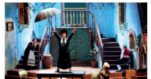
Der Barbier von Sevilla

Im Eilverfahren und unter enormem Zeitdruck, schrieb Gioacchino Rossini 1815, das Stück „Der Barbier von Sevilla“. Erst ein Misserfolg wegen Intrigen von Freunden und Bewunderern Paisiello, entwickelt sich das Stück noch zu Lebzeiten Rossinis zu der meist gespielten Oper.