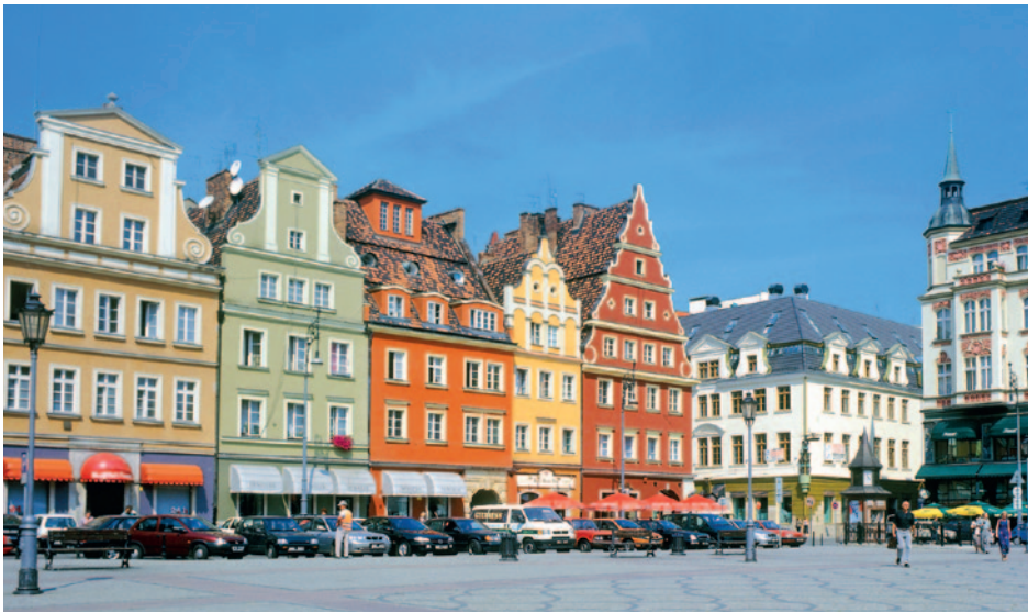
Breslau - Salzplatz

gesellschaftliche Druck und eine tödliche Krankheit besiegen ihren elementaren Liebes- wie Lebenswillen. Schon bald spielte das Stück von Giuseppe Verdi auf den Bühnen der Welt.