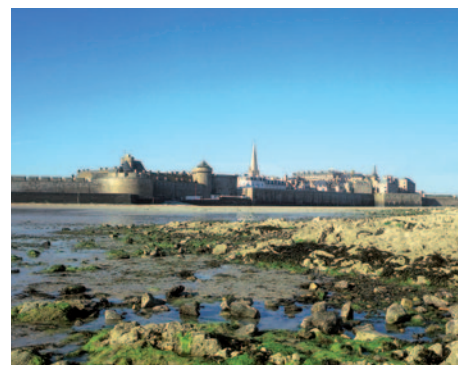
Saint Malo

Hinweis: Dieser Ausflug kann nur vor Reisebeginn gebucht werden. Eine Buchung vor Ort