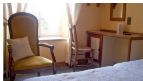
Hotel l'Abbaye - Zimmerbeispiel

Durchführungsgarantie ab 20 Personen D = Doppel, E = Einzel, T = Doppel/Zustellbett