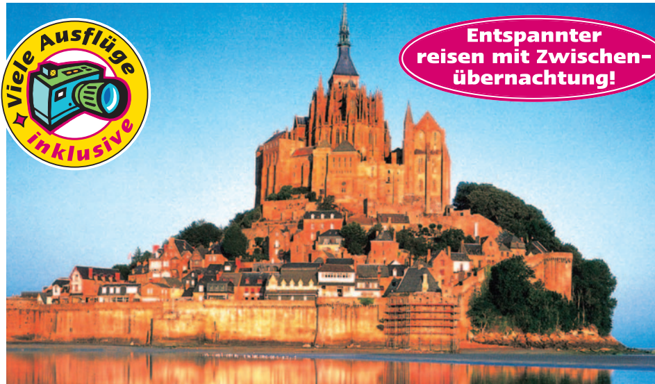
Mont St. Michel

ist nicht mehr möglich. Mindestteilnehmerzahl: 20 Personen. Ein Geldtausch für Jersey ist auf der Fähre möglich.