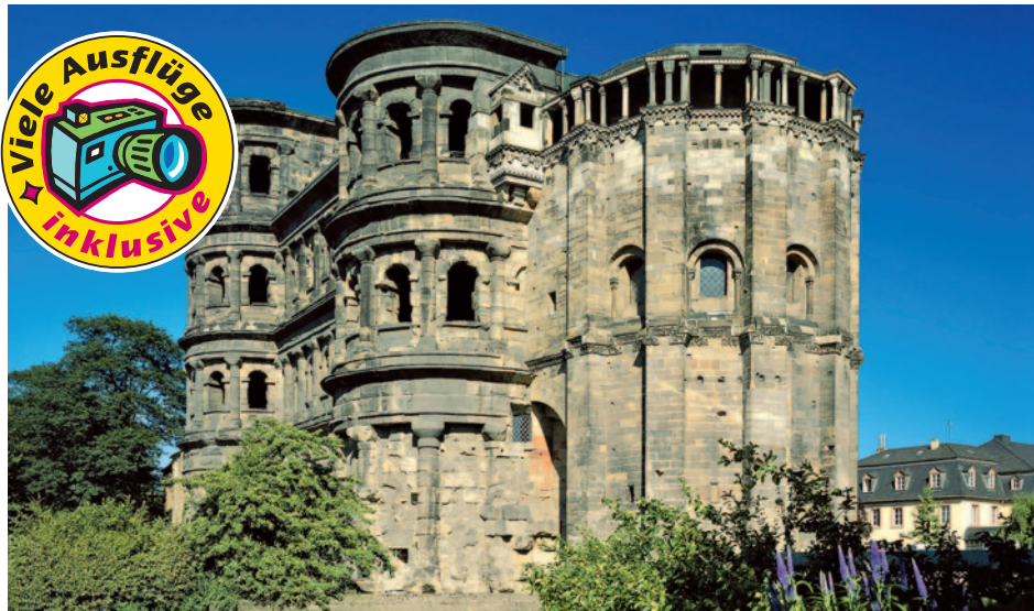
Trier - Porta Nigra

Kessel des gleichnamigen Maars. Vorbei am Mosenberg, dem einzigen Kratersee Europas nördlich der Alpen, fahren Sie in den Kurort Manderscheid mit seinen beiden imposanten Burgen. Am frühen Nachmittag fahren Sie zu den dunklen Augen der Eifel, den Dauner Maaren. Abendessen und Übernachtung im Hotel Hutter in Bremm.