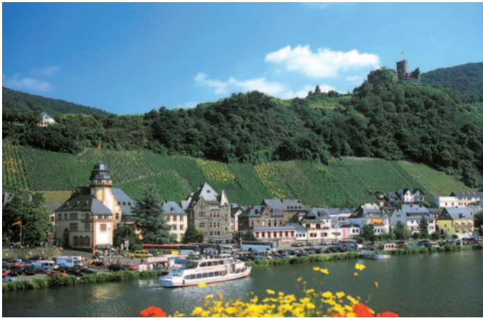
Mosel bei Berncastel-Kues