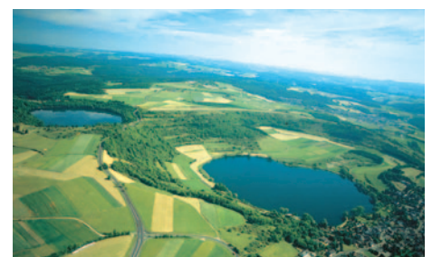
Eifel - Dauner Maar

Im Anschluss an das Frühstücksbuffet haben Sie heute die Möglichkeit, die Vulkaneifel kennen zu lernen (Extrakosten 20,- EUR p.P.). Ihr erster Stopp liegt gleich an der Pforte zur Vulkaneifel, an der Zisterzienser-Abtei Himmeroth. Von hier aus geht es weiter nach Meerfeld, wo Ihre erste Berührung mit dem Eifelvulkanismus stattfindet. Der Ort liegt im