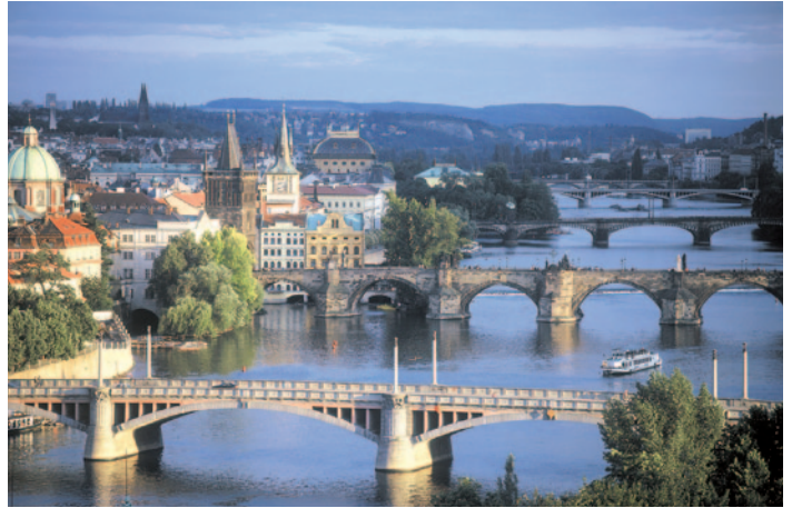
Moldau in Prag