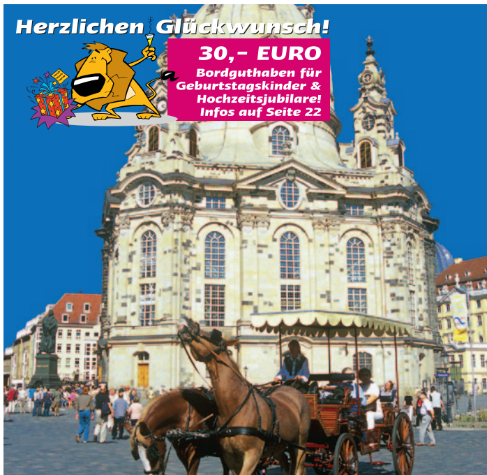
Frauenkirche in Dresden

Frühbucher sparen 3 % bis zum 31.03.2012!