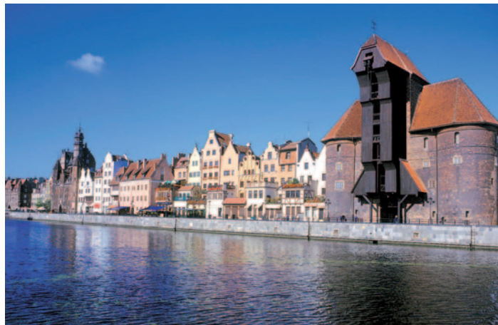
Danzig mit Krantor