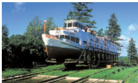
Oberländischer Kanal

Im malerischen Teil von Mragowo (Sensburg) am Schoss-See (Czossee), nahe dem Ortszentrum von Sensburg, befindet sich das 2008 neu eröffnete Mittelklassehotel Anek. Das Hotel bietet komfortable Bedingungen in freundlicher Atmosphäre. Die 59 Zimmer sind mit Bad oder DU/WC, Sat-TV, Telefon und teilweise mit Balkon ausgestattet. Bitte beachten Sie, dass sich einige Zimmer im Dachgeschoss befinden und diese nicht über Balkons verfügen. Den Gästen des Hotels stehen ein Restaurant, eine Bar, ein Grillplatz und ein Biergarten (witterungsabhängig) mit Ausblick auf den See zur Verfügung. Ein Lift ist im Hotel ebenfalls vorhanden.