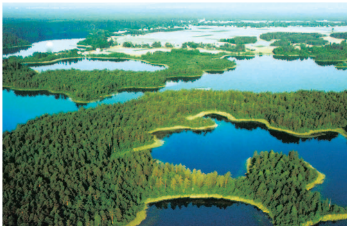
Blick über die Masurische Seenplatte