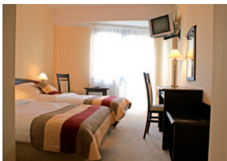
Hotel Anek - Zimmerbeispiel

Nachdem Sie gefrühstückt haben, verlassen Sie Masuren. Die Reise führt Sie nach Marienburg, wo Sie die Möglichkeit zur Besichtigung der gleichnamigen Burg (Eintritt inkl. Führung Extrakosten ca. 10,- EUR p.P.) haben. Anschließend Weiterfahrt nach Thorn. Einen Stadtbummel durch die Geburtsstadt des Astronoms Nikolaus Kopernikus sollten Sie sich nicht entgehen lassen. Abendessen und Übernachtung im Hotel Filmar in Thorn.