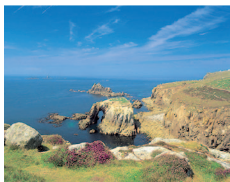
Land's End

Durchführungsgarantie ab 20 Personen D = Doppel, E = Einzel, T = Doppel/Zustellbett