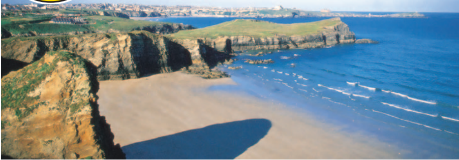
Küste bei Newquay