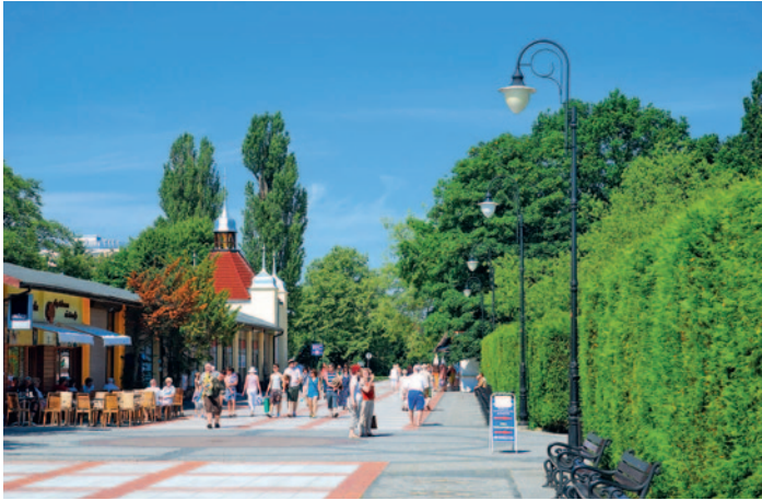
Bad Swinemünde - Strandpromenade