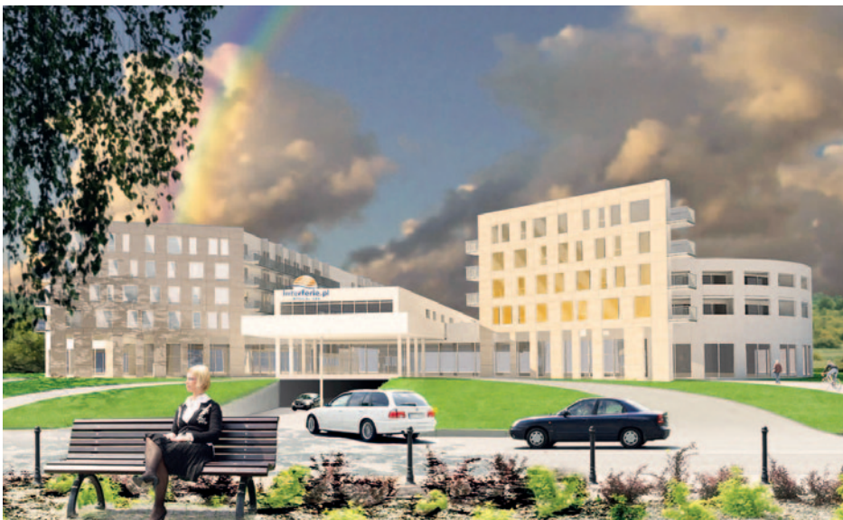
Kurkomplex Medical Spa (Zeichnung)

Perlbad, Wirbelfußbad, Wassergymnastik, Hydrojet, Diodynamik, Iontophorese, Phonophorese, Galvanotherapie, TENS-Ströme, Interdynamik, Sollux-Lampe, Biopton-Lampe, Infrarottherapie, Magnetfeldtherapie, Kryotherapie, Moorpackungen, Inhalation, Gruppengymnastik.