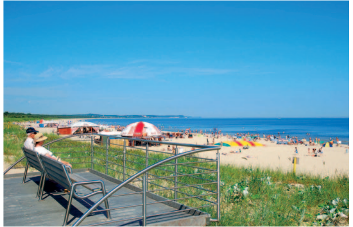
Bad Swinemünde - Strand