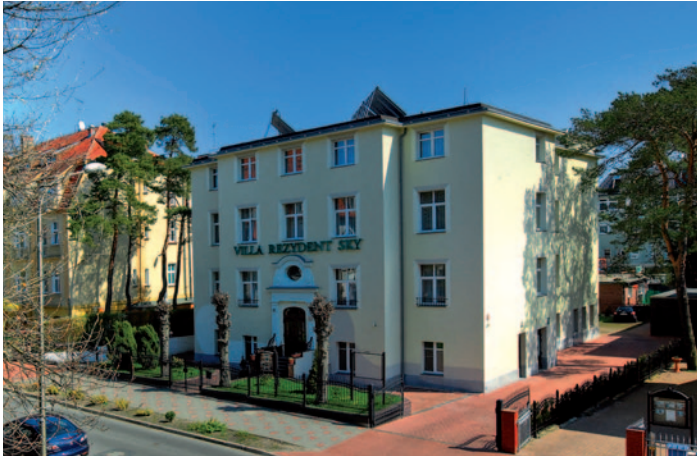
Villa Rezydent Sky