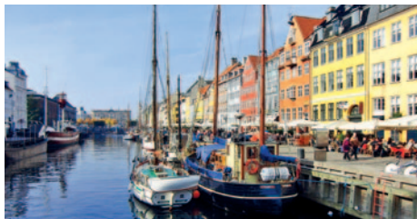
Kopenhagen - Nyhavn