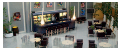
Hotel Lautrup Park - Bar

HP-Zuschlag: 4 x Abendessen (3-Gang-Menü oder Buffet) zubuchbar.