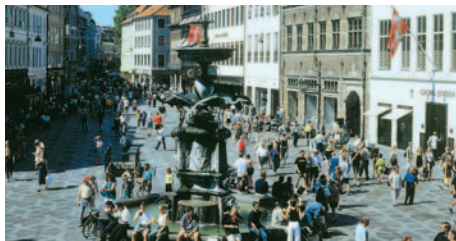
Kopenhagen - Amagertorv