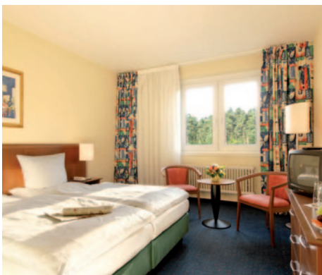
AHORN Seehotel Templin - Zimmerbeispiel

Durchführungsgarantie ab 20 Personen D = Doppel, E = Einzel, T = Doppel/Zustellbett