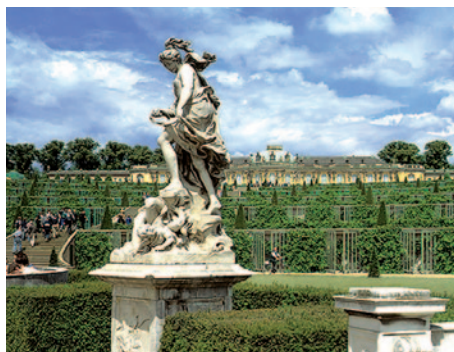
Potsdam - Schloss Sanssouci