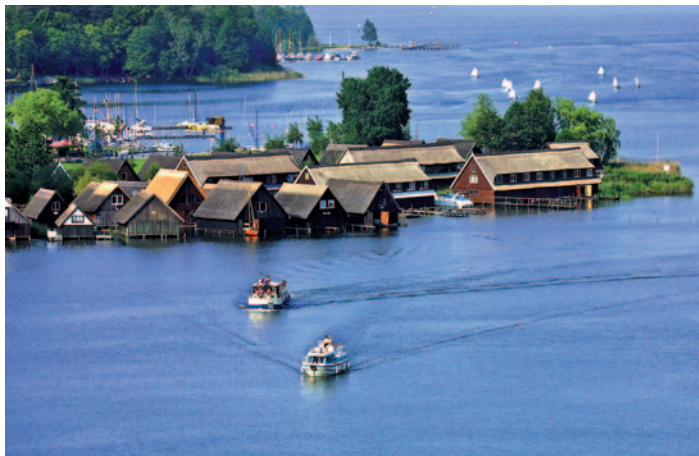
Mecklenburgische Seenplatte