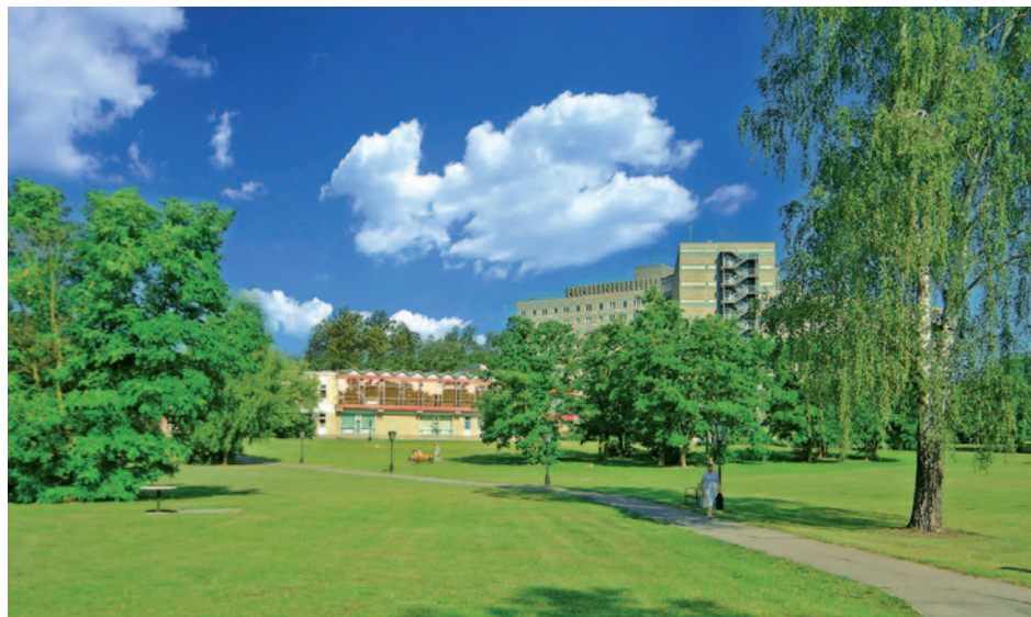
AHORN Seehotel Templin

Die Kurtaxe (ca. 1,50 EUR pro Person und Tag) bezahlen Sie bitte vor Ort.