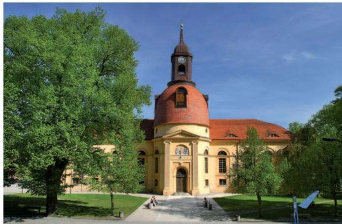
Pfarrkirche in Neuruppin