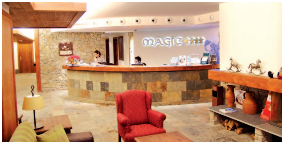
Hotel Magic La Massana - Lobby

Durchführungsgarantie ab 20 Personen D = Doppel, E = Einzel, T = Doppel/Zustellbett