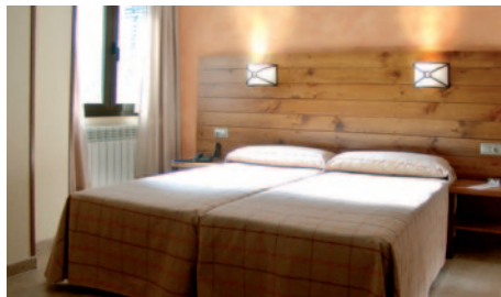
Hotel Magic La Massana - Zimmerbeispiel

9. Tag: Andorra - Raum Beaune Nach dem Frühstücksbuffet erfolgt die Rückreise nach Frankreich zur Zwischenüber-