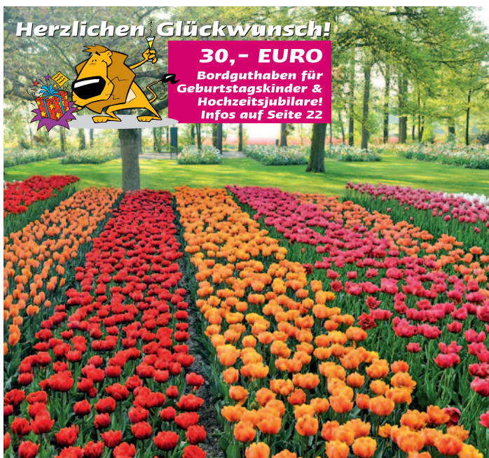
Tulpenblüte im Keukenhof

Schiffsbeschreibung von MS La Bohème auf Seite 27