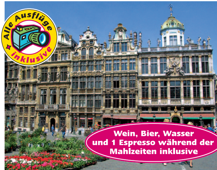
Brüssel - Grand Place