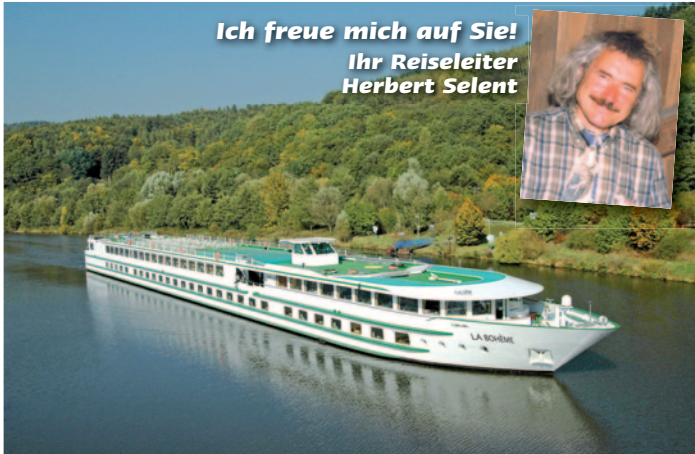
MS La Bohème