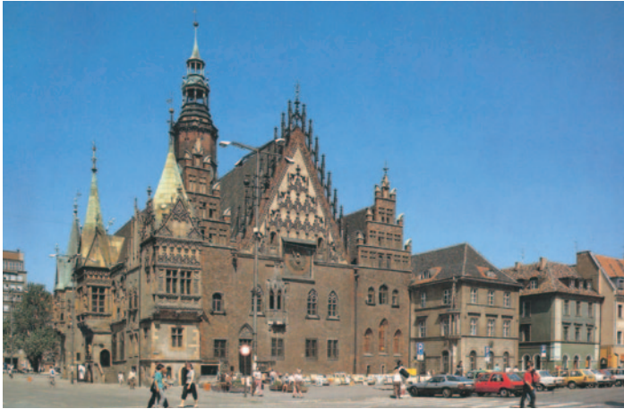
Rathaus in Breslau