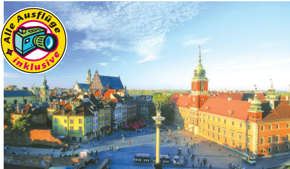
Königsschloss mit Sigismund Säule in Warschau