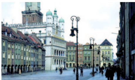
Stadthalle am Altmarkt in Posen

Nach dem Frühstücksbuffet besichtigen Sie die Hauptstadt Warschau. Die Altstadt wurde nach dem 2. Weltkrieg vollständig restauriert. Bei Ihrer Stadtbesichtigung werden Sie das Königliche Schloss und die Sankt-Johannes-Kathedrale kennenlernen. Der Marktplatz wird von Restaurants und Straßencafés gesäumt und in den angrenzenden malerischen Gassen gibt es zahlreiche Geschäfte, in denen Sie Andenken und kunsthandwerkliche Gegenstände erwerben können. Sehenswert sind u.a. die zahlreichen Paläste aus dem 17. und 18. Jahrhundert. Zu den Schönsten gehört das Palais Wilanów, etwas außerhalb der Stadt. Dieses Barockbauwerk diente einst als Residenz - besonders schön sind die Orangerie und Gartenanlagen. Ebenfalls reizvoll ist das Palais Zazienki. Das zuweilen auch als „Wasserschloss“ bezeichnete Palais ist vor allem wegen seiner Freilichtbühne bekannt. Abendessen und Übernachtung im Hotel Ibis Warszawa Stare Miasto in Warschau.