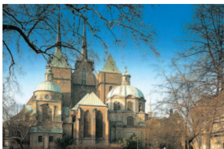
Dom in Breslau

Nach dem Frühstücksbuffet Abfahrt und Rückreise zum zentralen Abfahrtsort Magdeburg. Nach der Ankunft um ca. 16:30 Uhr Transfer zum gebuchten Zustiegsort und Taxiservice bis zu Ihrer Haustür.