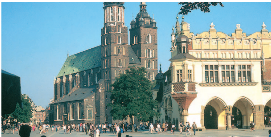
Tuchhalle in Krakau

Dauerhaft günstig: Ihr Reisepreis p.P. ab € 798,-