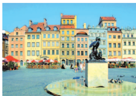
Altstädter Marktplatz in Warschau

Durchführungsgarantie ab 20 Personen D = Doppel, E = Einzel, T = Doppel/Zustellbett