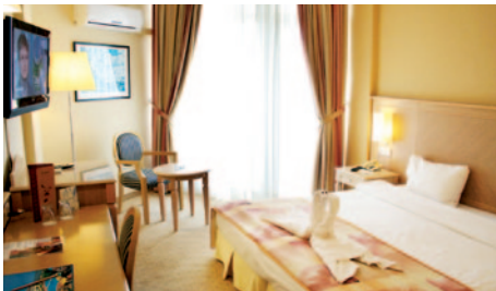
Hotel Salamis Bay Conti - Zimmerbeispiel

Freizeitangebot: Ohne Gebühr: Tennis, Tischtennis, Internetecke, Sauna und Hamam, Hallenbad, gepflegte Außenanlage mit Swimmingpool und Kinderspielplatz. Sonnenschirme, Liegen, Auflagen und Badetücher sind am Pool und am Strand kostenlos. Gelegentlich Live-Musik. Gegen Gebühr: Tennis mit Flutlicht und Tennisschläger, Billard und Massagen.