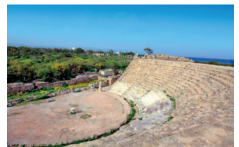
Salamis - Amphitheater

Frühstück. Am heutigen Vormittag besuchen Sie die Burg von Kantara, eine mittelalterliche Burgruine, die auf fast 700 Meter Höhe gelegen ist und in früheren Zeiten den Zugang zur Halbinsel Karpas kontrollierte. Von der Burg haben Sie einen atemberaubenden Blick über ganz Nordzypren und können ganz erhaben