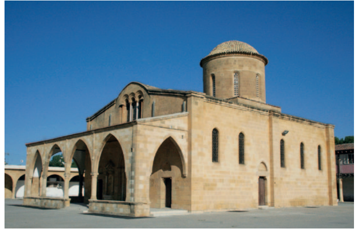
Güzelyurt - Kloster