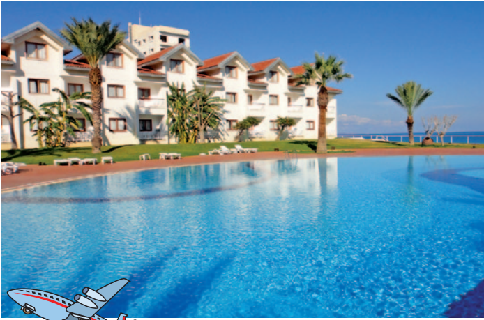
Hotel Salmis Bay Conti