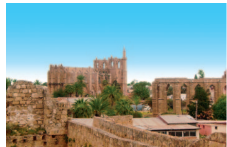
Famagusta - Blick über die Stadtmauer

D = Doppel, E = Einzel, T = Doppel/Zustellbett