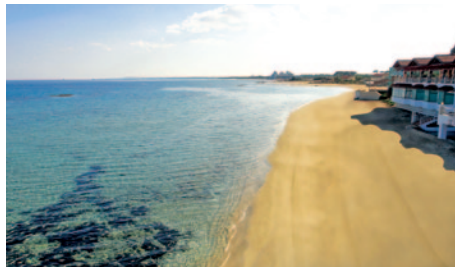
Hotel Salamis Bay Conti - Strand