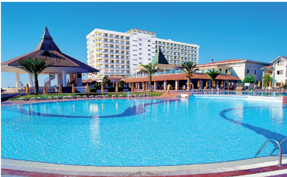
Hotel Salamis Bay Conti - Pool

Dauerhaft günstig: Ihr Reisepreis p.P. ab € 548,-