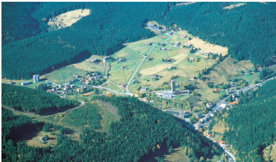
Hotel Horizont - Luftaufnahme

Dauerhaft günstig: Ihr Reisepreis p.P. ab € 288,-