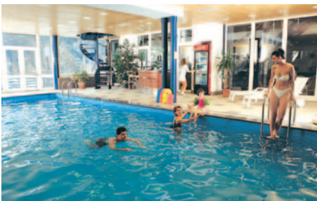
Hotel Horizont - Pool