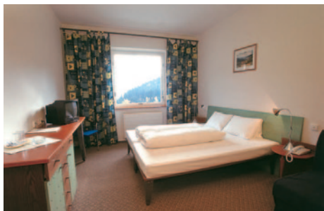
Hotel Horizont - Zimmerbeispiel

Das 4-Sterne-Hotel Horizont befindet sich inmitten herrlicher Natur im Nationalpark des Riesengebirges, direkt im Zentrum von Petzer. Alle 132 Zimmer sind mit DU/WC, Haarföhn, Telefon, Radio, Sat-TV, Minibar und Safe ausgestattet. Den Gästen des Hotels stehen ein Res-