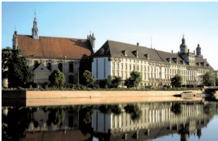
Breslau - Dominsel