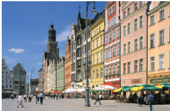
Rathausplatz in Breslau