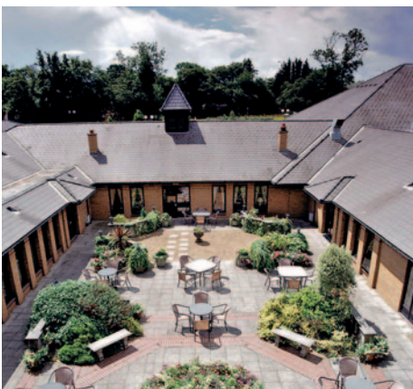
Hotel Bridgewood Manor