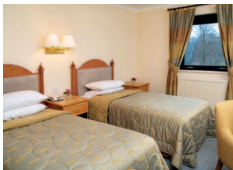
Hotel Bridgewood Manor - Zimmerbeispiel

Das Vier-Sterne-Hotel liegt südwestlich des Zentrums von Chatham und begrüßt seine Gäste mit 100 komfortablen Nichtraucher-Zimmern, alle mit Bad oder DU/WC, Haarföhn, Telefon, TV und Kaffee-/Teekoher. Zu den Einrichtungen des Hotels gehören ein Wellnessbereich mit Swimmingpool, Whirlpool und Sauna sowie ein einladender Innenhof mit Lounge/Bar und das für seine erlesene Küche bekannte Squires Restaurant.