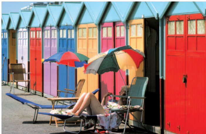
Badehütten an der Englischen Riviera