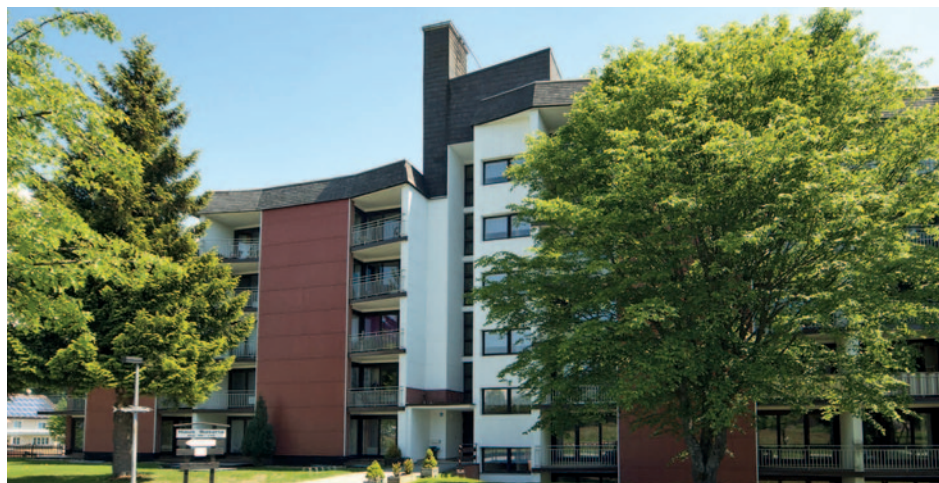
Ferienparkanlage Altreichenau - Haus Bavaria

Oberhalb von Neureichenau und im Grünen gelegen, befindet sich die Ferienparkanlage Altreichenau. Zur Anlage gehören neben den drei einzelnen Appartementshäusern (Haus Austria, Haus Bavaria und Haus Böhmen) auch eine Freizeithalle mit Rezeption, Hallenbad und Saunalandschaft mit Liegewiese (gegen Gebühr). Ebenfalls angeschlossen an die Freizeithalle ist das Restaurant der Anlage, in dem Sie täglich zu Frühstücksbuffet und Abendessen erwartet werden. Einen geselligen Hüttenabend mit typisch bayerischer Gaudimusik erleben Sie im Loipenstüberl, ca. 500 m von der Anlage entfernt. Die 200 Appartements bestehen aus kombiniertem Wohn-/Schlafraum mit Sitzecke, TV, Radio und großer Schrankwand mit integrierten Schrankbetten sowie Bad/WC und kleiner Küchenzeile. Nach einem erlebnisreichen Ausflugsstag können Sie bei einer Partie Minigolf (gegen Gebühr) auf der eigenen Anlage die Eindrücke des Tages Revue passieren lassen.