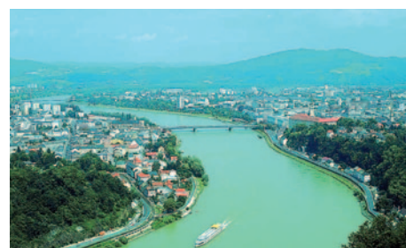
Donau bei Linz

Frühstücksbuffet. Heute geht es zu unseren Nachbarn nach Österreich. Neunzig Kilometer donauabwärts von Passau liegt Linz, die oberösterreichische Landeshauptstadt. In den letzten Jahrzehnten hat sich Linz zu einem pulsierenden Zentrum für Industrie, Natur, Tourismus, Kunst und Kultur entwickelt. 2009 war Linz Kulturhauptstadt Europas. Erleben und genießen Sie in Linz österreichische Gastfreundschaft und Gemütlichkeit. Der Rückweg führt Sie durch das romantische Donautal mit der berühmten Schlägener Schlinge. Abendessen und Übernachtung in der Ferienparkanlage Altreichenau.