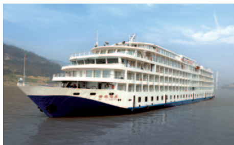
MS Century Diamond*****

Das neue, einzigartige 5-Sterne Deluxe Schiff, die MS CENTURY DIAMOND, wurde 2008 fertiggestellt. Schon beim Betreten werden Sie von der lichtdurchfluteten Lobby beeindruckt sein, die sich über fünf Decks erstreckt. Zwei gläserne Aufzüge verbinden sämtliche Decks mit Ausnahme des Sonnen-decks. Die Kabinen sind erstklassige Hotelzimmer mit geschmackvoller Einrichtung und verfügen über Balkon, Dusche/WC, SAT-TV, Haartrockner, Minibar, Safe, Telefon und regulierbare Klimaanlage. Die Deluxe-Kabinen sind ca. 23 m 2 groß, die Junior-Suiten sind 31 m 2 groß (jeweils inklusive Balkon) und verfügen über zwei getrennte Hotelbetten, die auch zusammengestellt werden können.