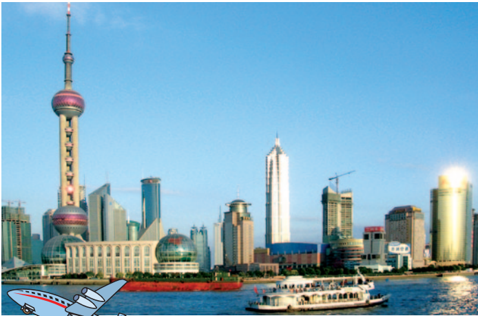
Shanghai - Pudong