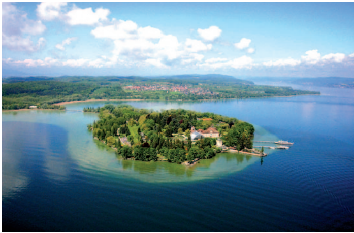
Blick auf die Insel Mainau