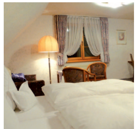
Hotel Landhaus Köhle - Zimmerbeispiel

Durchführungsgarantie ab 20 Personen D = Doppel, E = Einzel, T = Doppel/Zustellbett