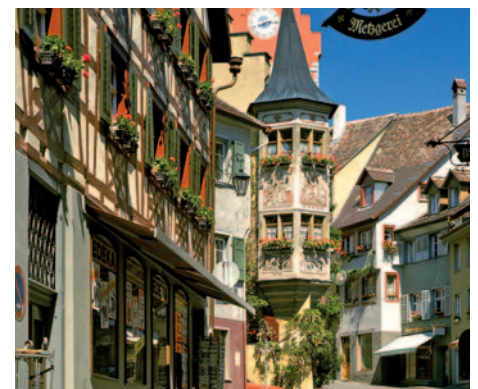
Meersburg - Obertor

barocke Klosterkirche Birnau, die als Glanzpunkt der oberschwäbischen Barockstraße gilt, entdecken. Nach einer Besichtigung erwartet Sie der letzte Stopp an diesem Tag. Es geht nach Ravensburg, das sich schon aus der Ferne als eine Stadt mit mittelalterlichem Charakter zu erkennen gibt. Zu Füßen der Ruine Veitsburg liegt der malerische alte Stadtkern. Auf halber Berghöhe erhebt sich das Wahrzeichen der ehemaligen Reichsstadt, der 50 Meter hohe „Mehlsack“, ein mit Zinnenkranz bewehrter Rundturm, erbaut um 1350. Bei einem Spaziergang durch die Stadt werden Sie viele steinerne Zeugen der Vergangenheit kennen