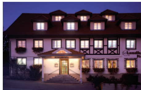
Hotel Landhaus Köhle

Das Hotel-Restaurant Landhaus Köhle befindet sich in dem kleinen Ort Neukirch im Hinterland des Bodensees. Alle 24 Nichtraucherzimmer sind einfach, gemütlich eingerichtet und verfügen über Bad oder DU/WC und Sat-TV. Bitte beachten Sie, dass die Zimmer in Form, Größe und Ausstattung unterschiedlich sind und einige Zimmer eine Dachschräge haben. Das Hotel bietet seinen Gästen ein gemütliches Restaurant. Das Hotel verfügt über KEINEN Lift.