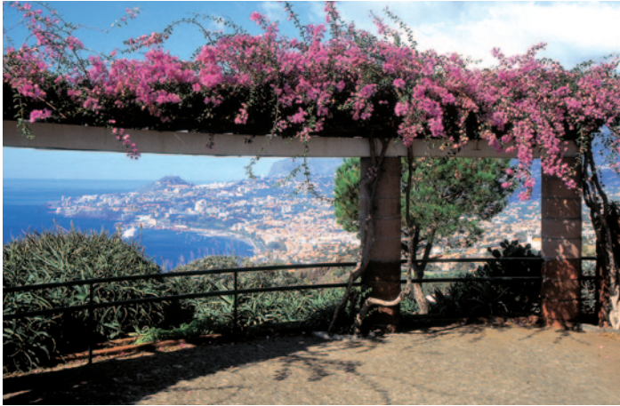
Herrliche Aussichten auf der Blumeninsel