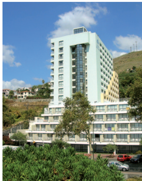
Hotel Alto Lido

Mietsafe, Klimaanlage/Heizung, Minibar und Balkon mit seitlichem Meerblick ausgestattet sind. Das Hotel bietet Rezeption, Restaurant, Bar, Café, Poolbar, Sonnenterrasse, Fitnessraum, Billiard, Tischtennis, Squash-Feld, Sauna sowie einen Innen- und Außenpool (Freizeiteinrichtungen teilweise gegen Gebühr).