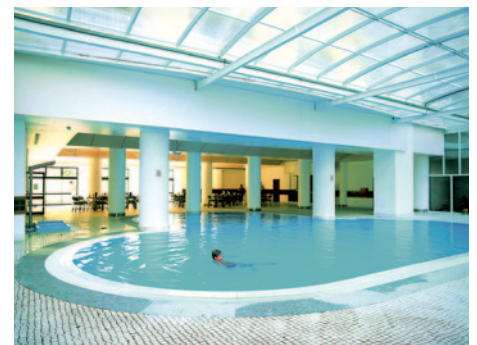
Hotel Alto Lido - Pool

Frühstück. Der heutige Tag steht Ihnen zur freien Verfügung. Abendessen und Übernachtung im Hotel Alto Lido in Funchal.