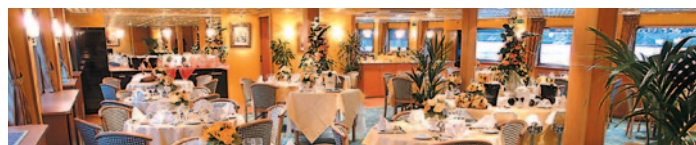
MS Renoir - Restaurant