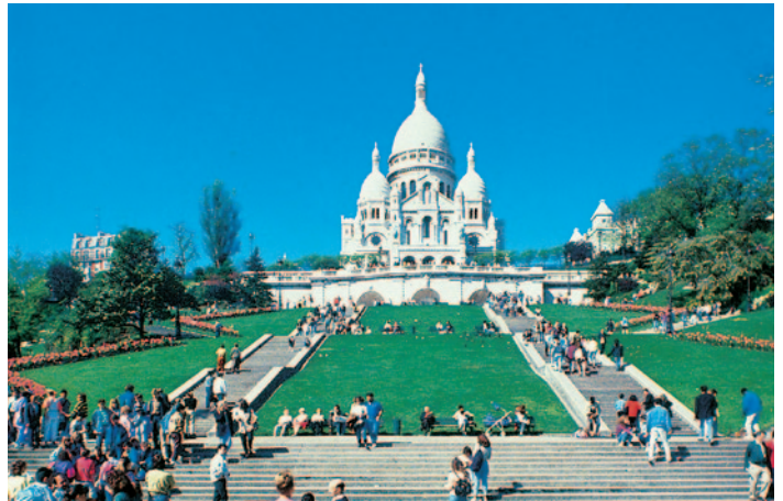
Sacre Coeur in Paris