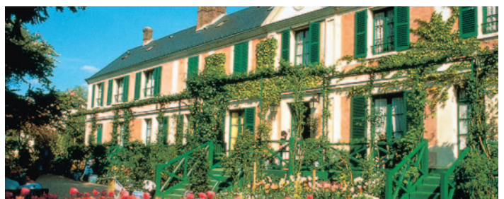
Monet-Haus in Giverny