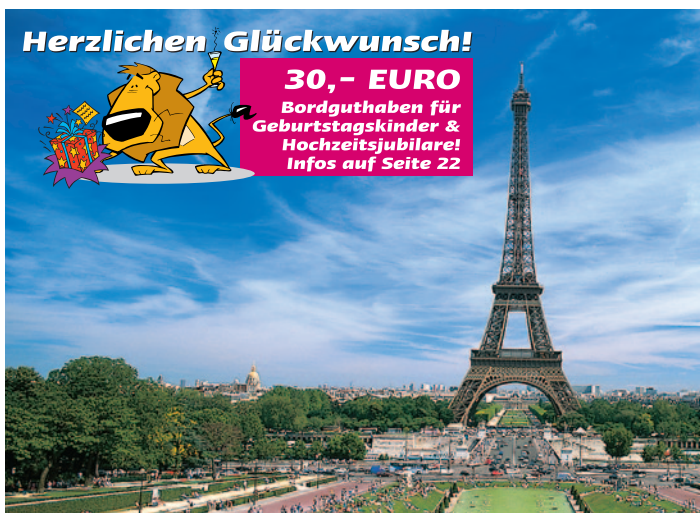
Eiffelturm in Paris

Versicherungspaket: 59,00 (Reisepreis bis 1500,-) (ohne Selbstbehalt) 69,00 (Reisepreis bis 2000,-) 88,00 (Reisepreis über 2000,-)